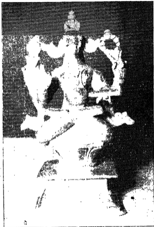
ದಾಸರು ಪೂಜಿಸಿ, ಅರ್ಚಿಸಿದ ಹಯವದನಮೂರುತಿ