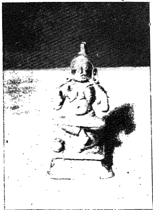
ದಾಸರು ಆಚರಿಸಿದ ಶ್ರೀ ವೇದವ್ಯಾಸ ಮೂರುತಿ