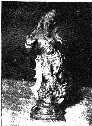
ದಾಸರಿಂದ ಆಚಾರ್ತನಾದ ಶ್ರೀದವಿತಲರಿಗೆ ಒಲಿದು ನಲಿದ ಶ್ರೀ ಮುರಳೀ ಕೃಷ್ಣ