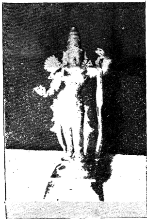
ದಾಸರು ಅರ್ಚಿಸಿದ ಶ್ರೀದವಿಠಲರಿಗೆ ಒಲಿದ ಶ್ರೀರಾಮ