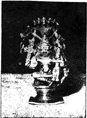
ದಾಸರು ಪೂಜಿಸಿದ ನರಸಿಂಹ ಮೂರುತಿ